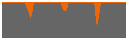
povrch po nanesení ochranného prostředku

Náš ochranný prostředek vytváří na ošetřeném povrchu vrstvu, která svými unikátními vlastnostmi napodobuje lotosový květ. Ten je známý tím, že za všech okolností zůstává vždy čistý.